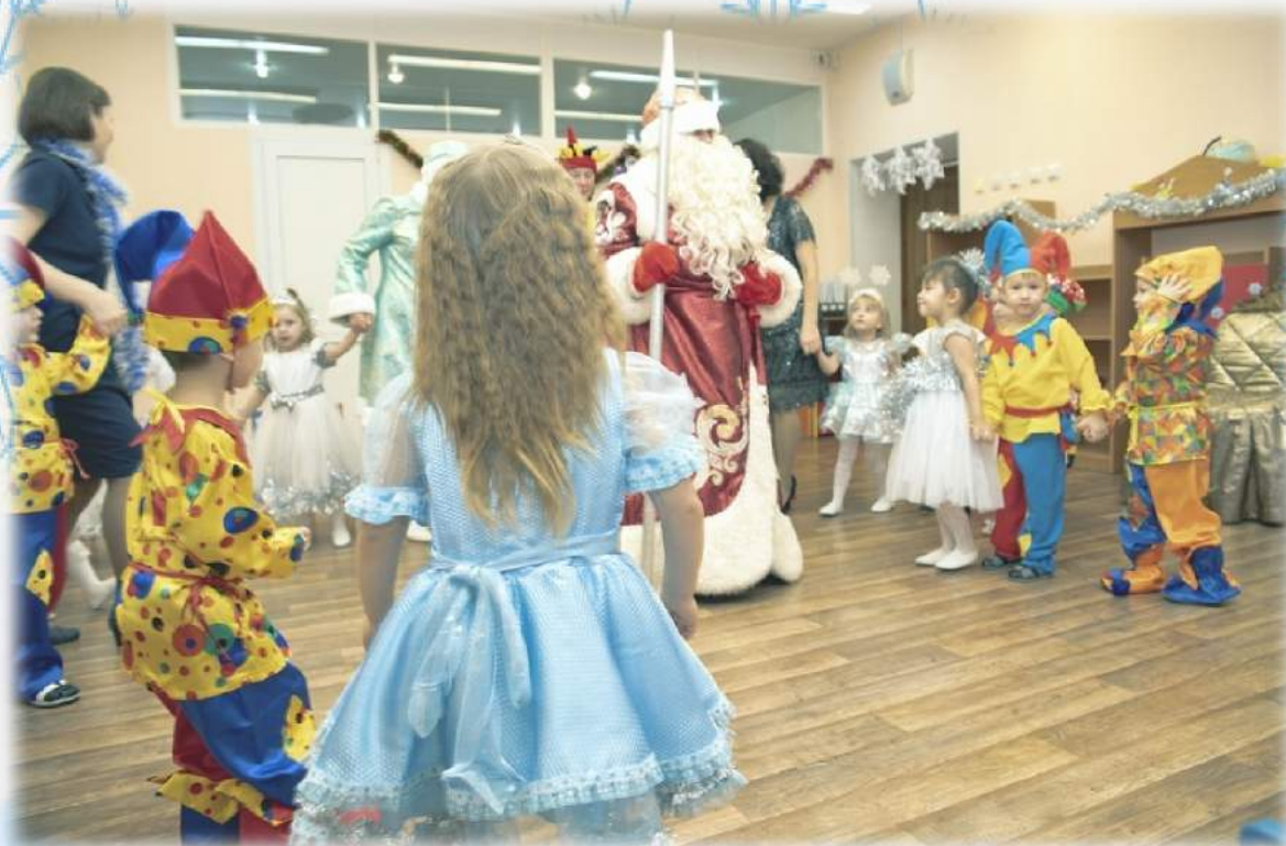
Танец «Шоколадные игрушки»