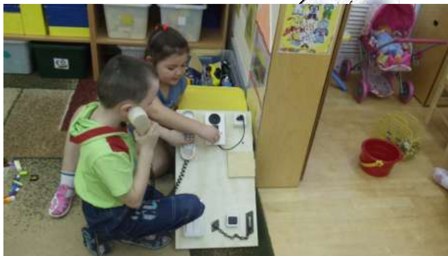
«Один дома: правила безопасности с электроприборами»