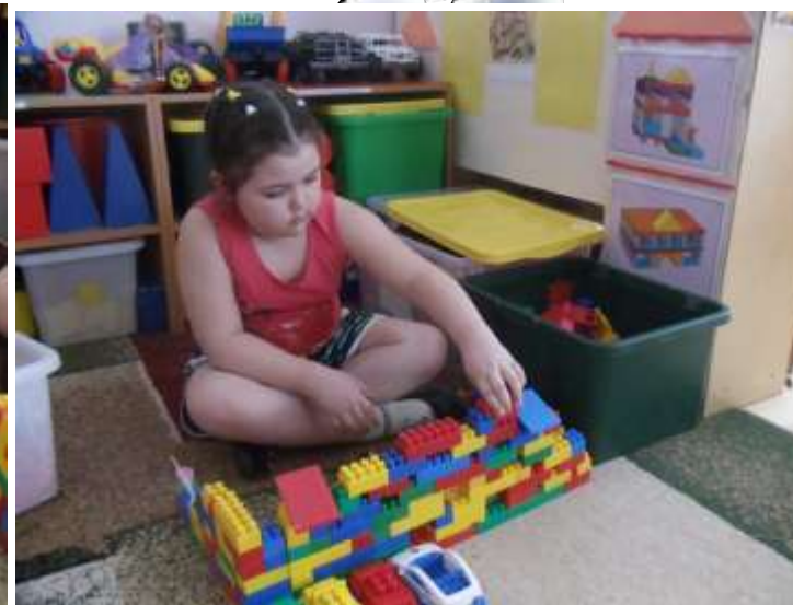
Дом в котором живу я и моя семья