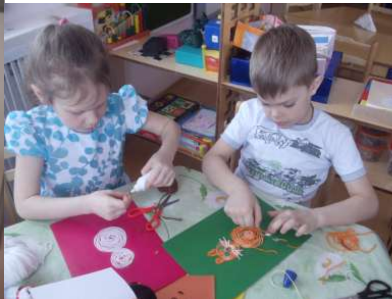
Наш домашний любимец