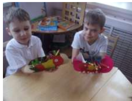
Подарок для родителей (органайзер)