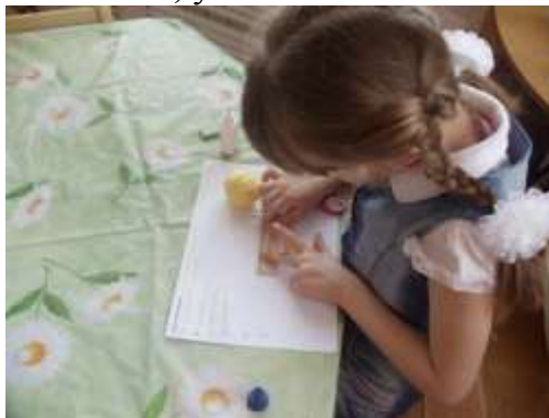
Центр математики «Помоги разложить бабушке нитки по длине»

Во время всего нашего проекта дети рисовали, играли, узнавали, оформляли с родителями альбомы «Наше семейное блюдо», «Наш питомец», «Родословное дерево моей семьи», учили стихи.