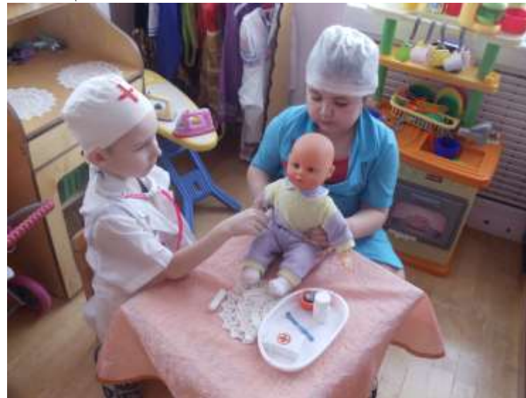
С-р игра «Семья» Сюжет «Заболел ребёнок