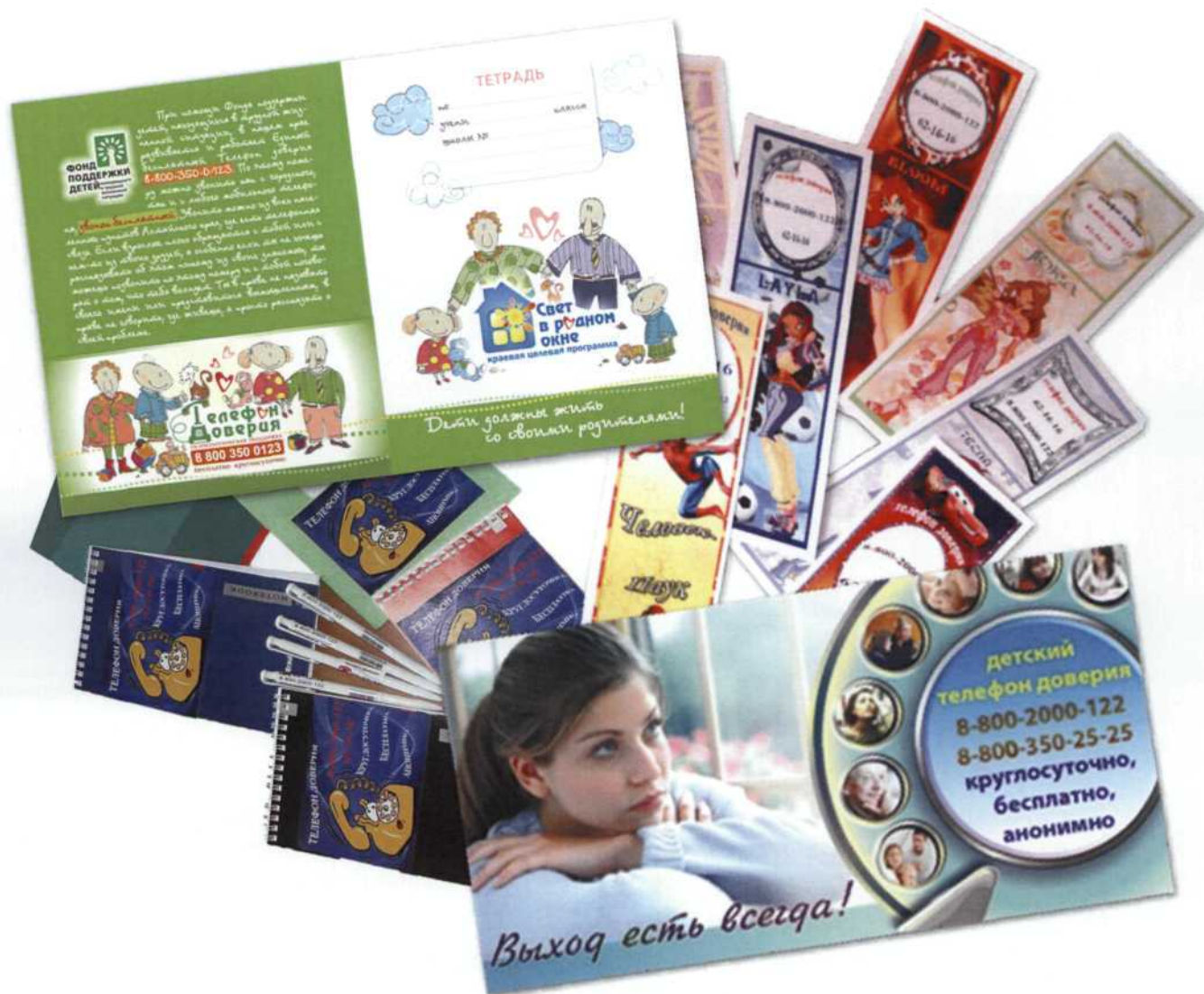
Примеры размещения рекламы детского телефона доверия на канцелярских принадлежностях

Более чем в 50-ти регионах проводятся масштабные региональные акции «Скажи телефону доверия «ДА!», «Давай с тобой поговорим!», «Сделай шаг к безопасности!» и др., в ходе которых сотрудники служб и волонтеры раздают детскому и взрослому населению карманные календари, буклеты, информационные листки с номером детского телефона доверия.